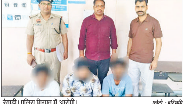
रेवाड़ी। पुलिस गिरफ्त में आरोपी।

वाले विद्यार्थियों को 1100 रुपये का नकद पुरस्कार देकर सम्मानित किया गया।