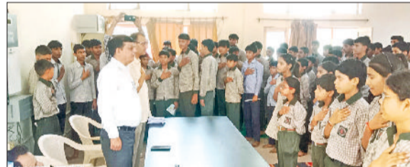
रेवाड़ी। विद्यार्थियों का शायब दिलाते हुए पुलिस टीम।