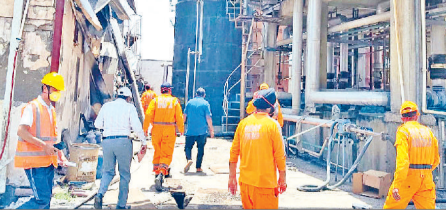
रेवाड़ी। कंपनी में मौजूद एनडीआरएफ टीम का फाइल फोटो।

कर्मचारी की गुरुग्राम के अस्पताल में मौत हो गई। कंपनी में लगी आग के बाद दो से तीन कर्मचारियों के लापता होने की सूचना है। दो कर्मचारियों के परिजन पुलिस को शिकायत दर्ज करा चुके हैं। बड़ी संख्या में अप्रवासी श्रमिक कंपनी में कार्यरत थे, जिस कारण यह आंकड़ा बढ़ भी सकता है। लापता कर्मचारियों के जिंदा जलने की आशंका के चलते ही बटिंडा से नेशनल डिजास्टर रिस्पॉन्स फोर्स बुलाई गई थी। एनडीआरएफ की टीम ने बुधवार दोपहर ही मैनुअल सर्च ऑपरेशन शुरू कर दिया था, परंतु भारी-भरकम मलबा हटाना आसान नहीं था। जेबीबी और पोपलिन मशीनों से मलबा हटाने के प्रयास शुरू किए, तो मलबे के नीचे से आग की लपटें निकलने के कारण टीम का सर्च अभियान प्रभावी साबित नहीं हुआ। टीम के सूत्रों ने बताया कि कंपनी के रिपेक्टर और बॉयलर इतने भारी हैं