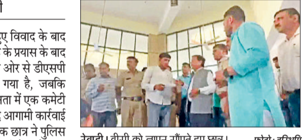
रेवाड़ी। वीसी को ज्ञापन सौंपते हुए छात्र।