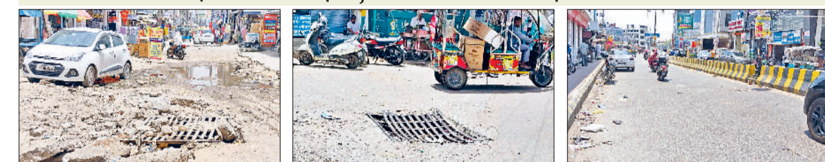
रेवाड़ी। रेलवे रोड पर अधूरा पड़ा सड़क निर्माण कार्य, रेलवे चौक पर धंसी मेनहोल की जाली व आंबेडकर चौक से धारुहेड़ा चुंगी की सड़क, जिसका नव निर्माण होना है।

नगर परिषद की ओर से टेका लेने वाले ठेकेदार की ओर से किस्तों में बनाई जा रही सड़क, खोद कर डाली सड़क से परेशान लोग