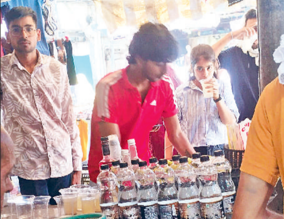
रेवाड़ी। गर्मी से बचाव के लिए शीतल पेय पीते हुए लोग।

नौतपा शुरू होने में अभी चार दिन का समय बचा हुआ है, लेकिन इससे पहले ही गर्मी प्रचंड रूप धारण कर चुकी है। भारी गर्मी के बीच तापमान में मामूली गिरावट का कोई असर नहीं हो रहा है। बिजली की खपत गर्मी के साथ-साथ बढ़ रही है। इस सीजन में खपत 100 करोड़ यूनिट के पास पहुंच गई है, जो इस बार जल्द ही पिछला आंकड़ा भी पार सकती है। इस माह के अंत तक भारी गर्मी से राहत की उम्मीद नहीं है। गर्मी के प्रचंड रूप से जनजीवन बुरी तरह प्रभावित कर दिया है। दो दिन से रात का तापमान बढ़ने के कारण सुबह से ही भारी गर्मी का प्रकोप शुरू हो जाता है। सुबह 10 बजे के बाद गर्म हवाएं लोगों को घरों में ही रहने पर मजबूर कर देती हैं। लोग जरूरी कार्य से ही घरों से बाहर निकलते हैं। तेज धूप और हवाओं की बढ़ती रफ्तार से लू चलनी शुरू हो जाती है। वीरवार को अधिकतम तापमान 1.0 डिग्री सेल्सियस की गिरावट के साथ 44.5 डिग्री सेल्सियस दर्ज किया गया। न्यूनतम तापमान 0.8 डिग्री बढ़कर 29.0 डिग्री पर पहुंच गया। गत वर्ष की तुलना में दिन का तापमान सामान्य से कम और रात का ज्यादा बना हुआ है। बीते वर्ष 21 मई को अधिकतम तापमान 45.5 डिग्री और न्यूनतम 26.0 डिग्री सेल्सियस दर्ज किया गया था। हवा